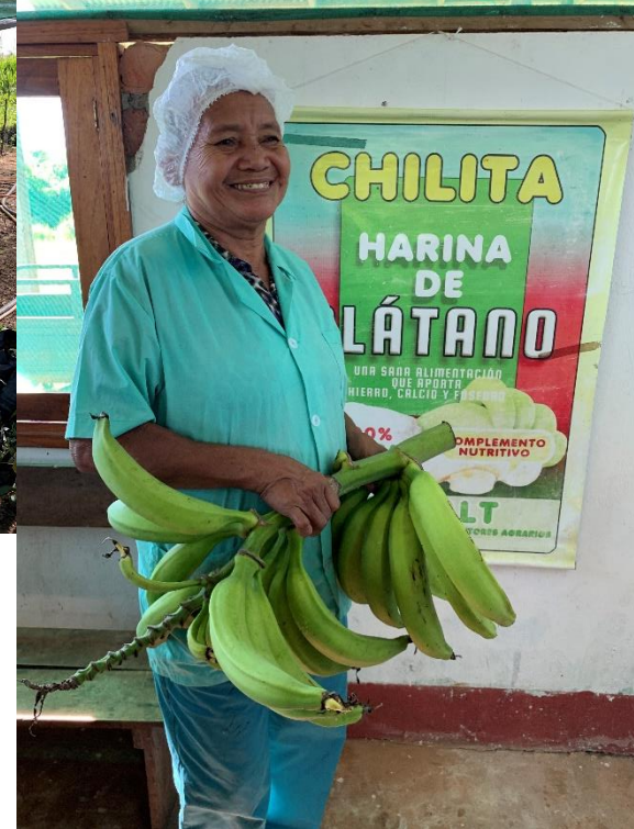
Cooperativas y asociaciones