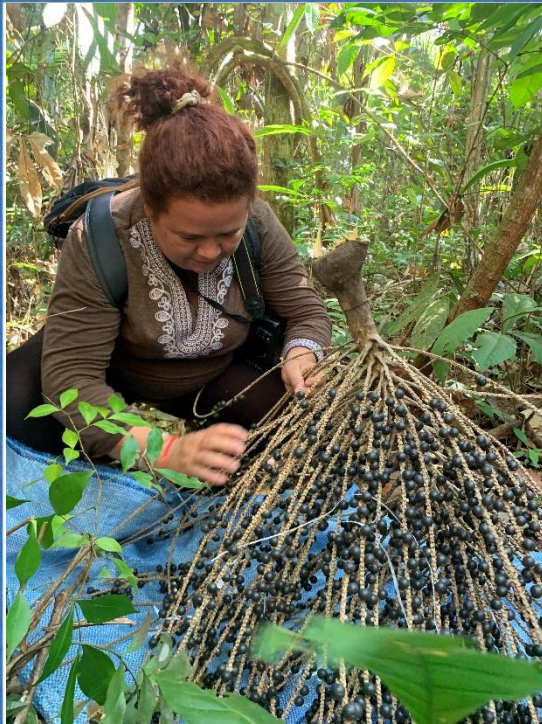
Frutos Amazónicos: Asaí, Majo, Nuez del Brasil, Plátano, etc.