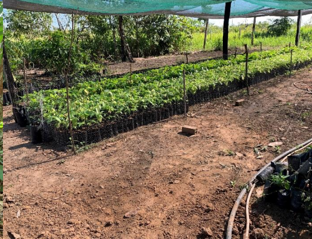
Reforestación, cuidado y regeneración de los suelos, lucha contra el fuego.